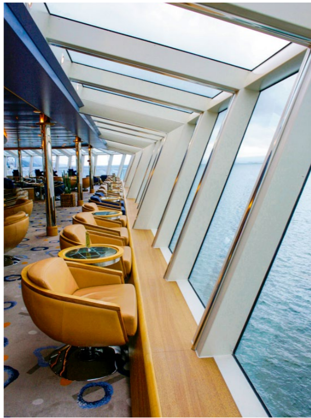
EXPLORER SALON & BAR